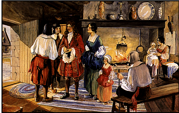
Jean Talon visitant les habitants

Peu à peu migrants ou engagés affluent ; ces derniers sont logés chez l'habitant trois ans durant au terme desquels ils ont le choix entre rentrer en France ou demeurer dans la colonie, auquel cas on leur remet une terre, des provisions et des outils. Les émigrants quand à eux se voient allouer une terre défrichée sur deux arpents, de quoi subsister pour un an ou deux et des outils en échange de leur promesse de défricher à leur tour deux arpents et de les cultiver pour un nouveau venu. Une partie des soldats du régiment de Carignan dissous en 1668 et une autre des quatre compagnies de M. de Tracy sont également convaincues de s'installer en Nouvelle-France, suivant la volonté du roi qui « desireroit qu'ils demeurassent tous en Canada. »