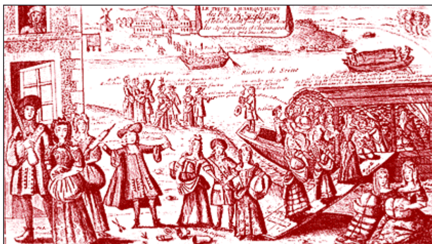
Arrivée de Filles du roi en Nouvelle-France.