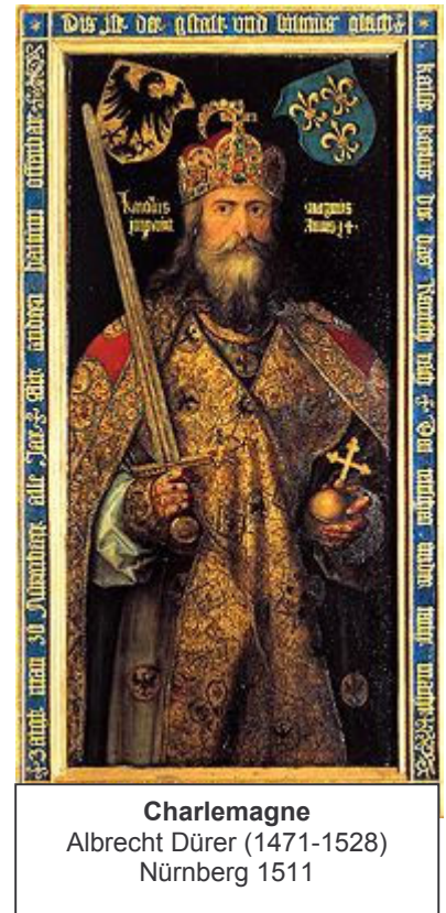
Charlemagne Albrecht Dürer (1471-1528) Nürnberg 1511