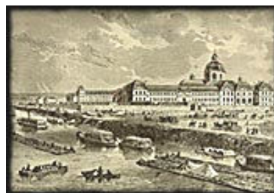
Hôpital de la Salpêtrière

Entre 1663 et 1673, près de 800 Filles du roi ont été envoyées pour fonder une famille et peupler la colonie.